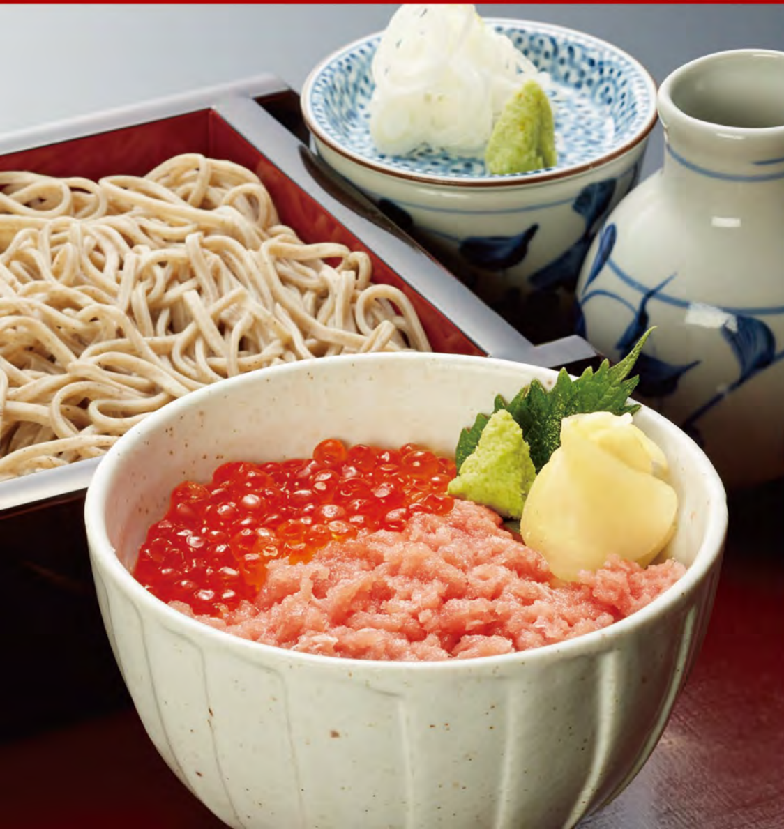
❖ 門前 せいろそば ミニ二色丼 (ねぎとろ・いくら)