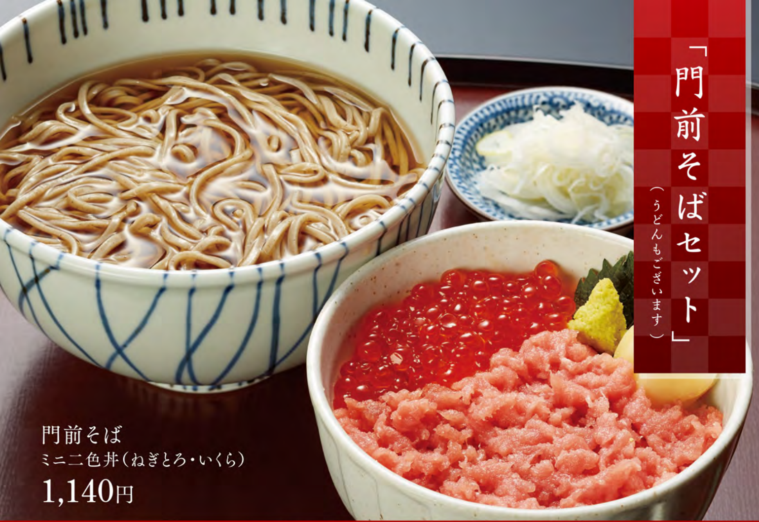
門前そば ミニ二色丼(ねぎとろ・いくら)