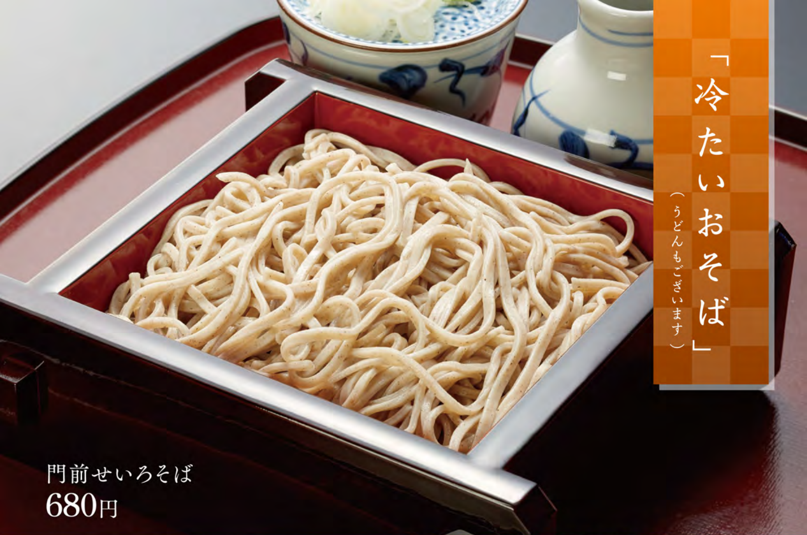
門前せいろそば 680円